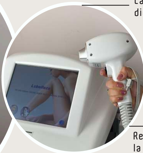
Láser de diodo SLD